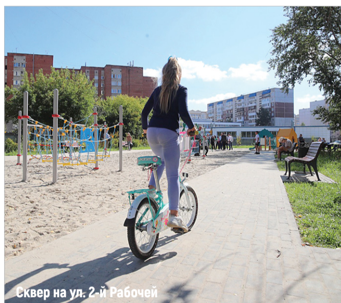
Сквер на ул. 2-й Рабочей