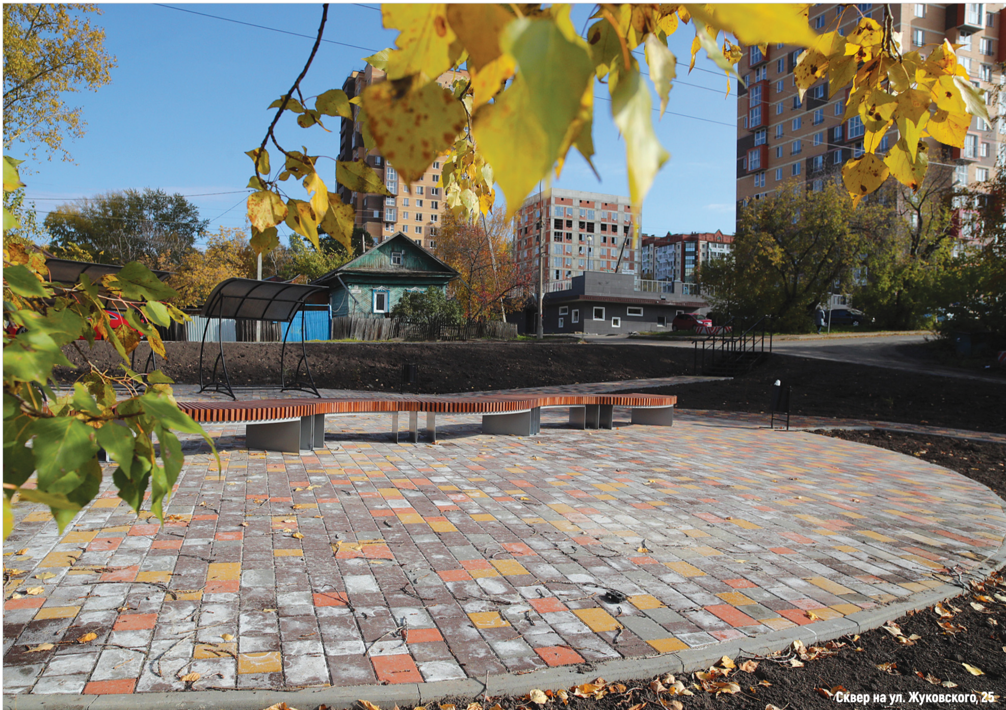
Сквер на ул. Жуковского, 25

7 МЯЧ ДРУЖБЫ В Томске прошёл турнир по волейболу на разных языках