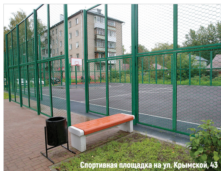
Спортивная площадка на ул. Крымской, 43