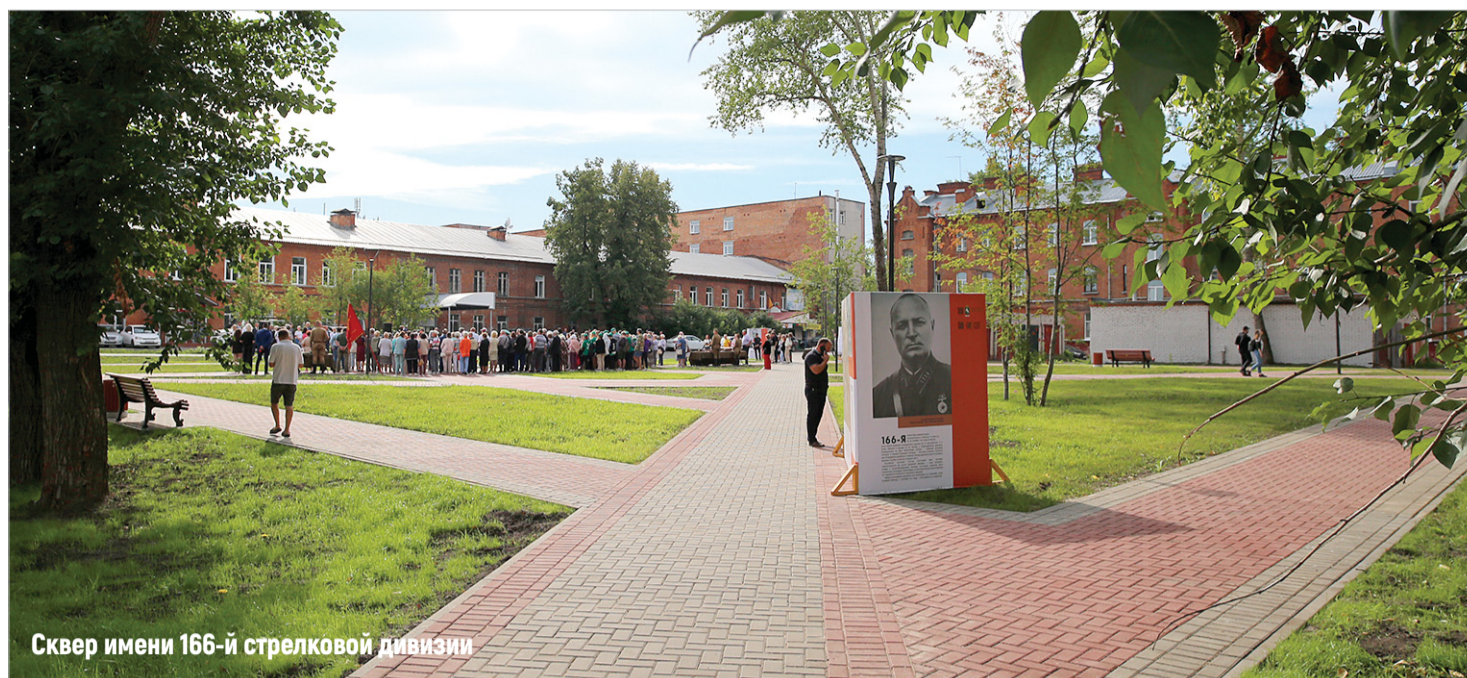
Сквер имени 166-й стрелковой дивизии

В текущем сезоне в рамках проекта «Формирование комфортной городской среды» обустроены также общественные пространства на ул. Красноармейской, 116-118, Лазарева, 3а-3б; ул. Ф. Мюнниха, 16; ул. Смирнова, 16; ул. Обручева, 10-12; ул. Пушкина, 52-54, ул. Сибирской, 118, ул. Крымской, 43, лесопарке Звездном.