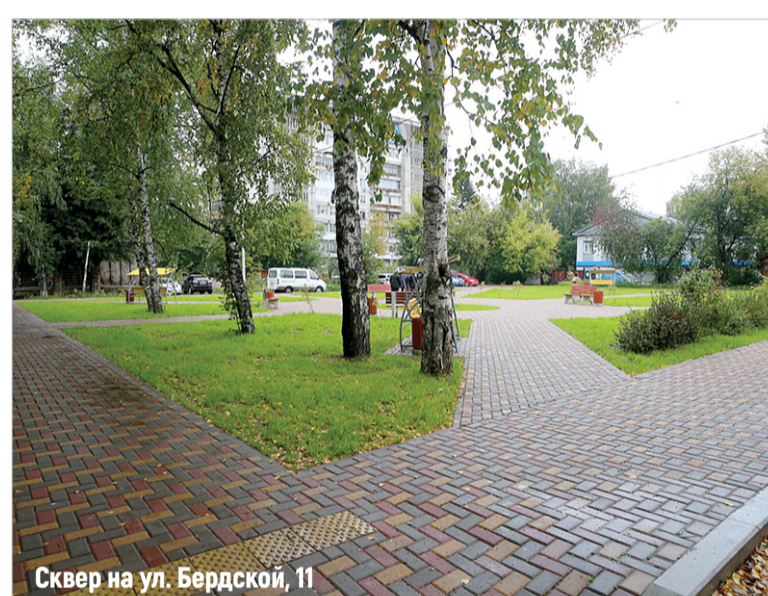
Сквер на ул. Бердской, 11