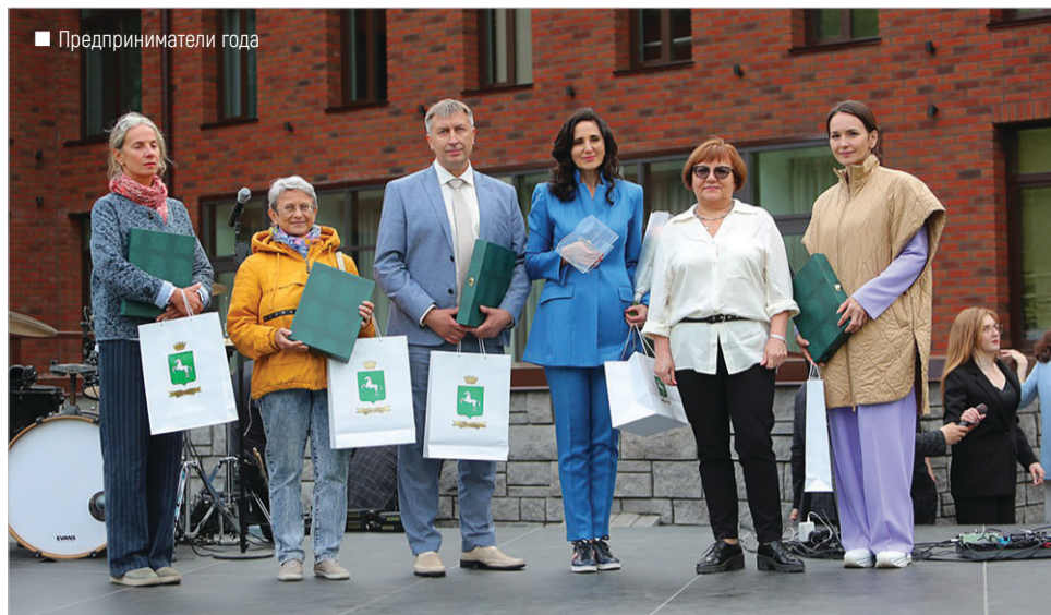
■ Предприниматели года

К 2022 году в Книгу почета были внесены такие компании, как ОАО «Томское пиво», ООО «Газпром трансгаз Томск», ООО «Газпромнефть – Восток», ООО «Томскнефтехим», АО «ТЭМЗ», АО «Томский электромеханический завод им. В.В. Вахрушева», АО «НПЦ „Полус“»,