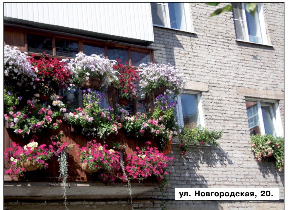
ул. Новгородская, 20.