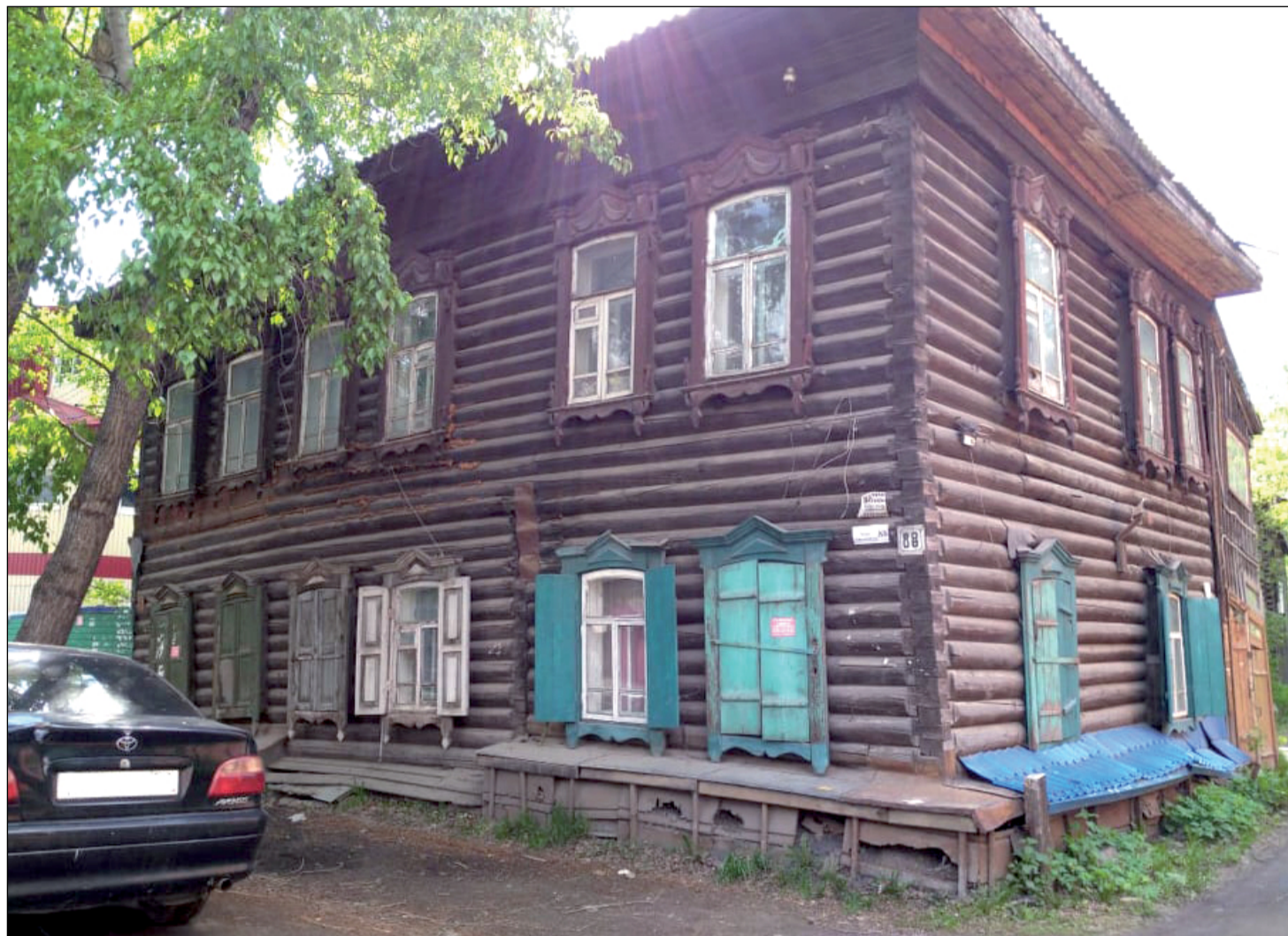
Дом по ул. Розы Люксембург, 88, - в списке расселения на 2021 год.

- В 2020 году путем электронных аукционов было приобретено 99 квартир для предоставления гражданам, владельцам еще 94 квартир было выплачено возмещение, кроме того, 29 собственников получили возмещение на основании судебных решений, — рассказал зам. мэра по архитектуре и строительству Алексей Макаров. — Чтобы завершить этап расселения-2020, нам необходимо приобрести и предоставить еще 12 квартир. Мы дважды выходили на электронный аукцион, но торги не состоялись — не было заявок от