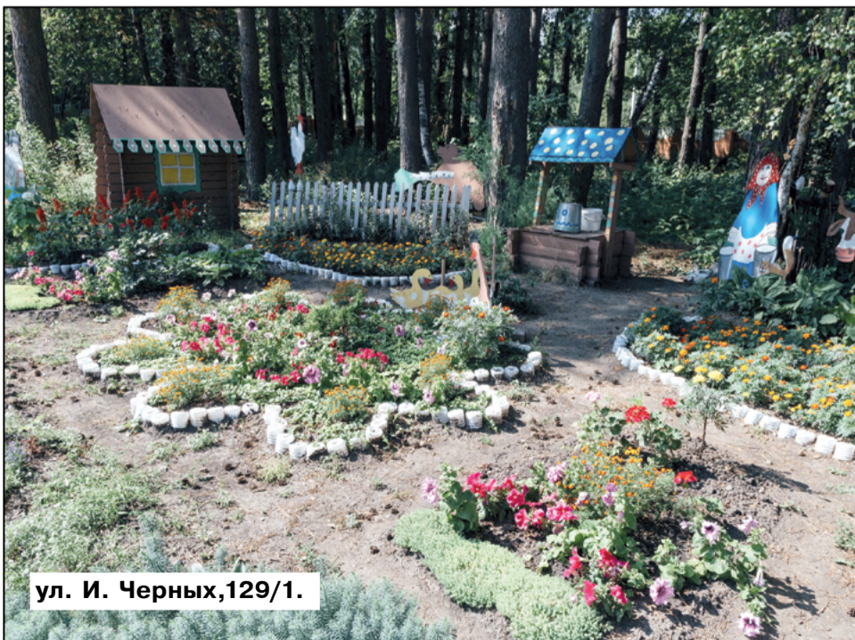
ул. И. Черных, 129/1.

Балкон на ул. Новгородской, 20, кв.85, уже не современный, как и сам дом, но из-за цветов он превращается в цветущий сад. Все, кто проходит мимо дома, любуются им и называют его «райский уголок». Они поднимают настроение и с улицы выглядят просто восхитительно. «Когда видишь такой балкон, душа радуется», - говорят соседи.