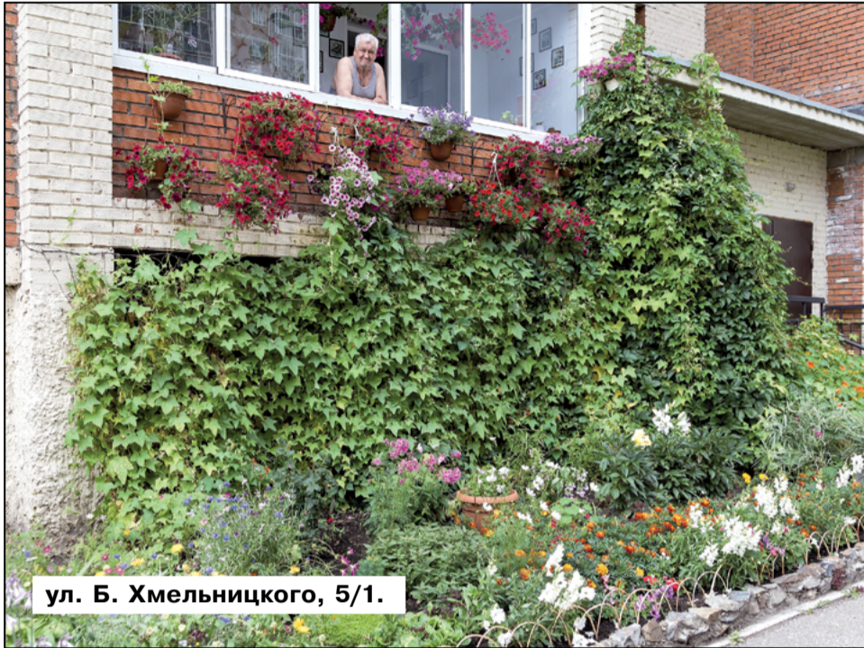
ул. Б. Хмельницкого, 5/1.