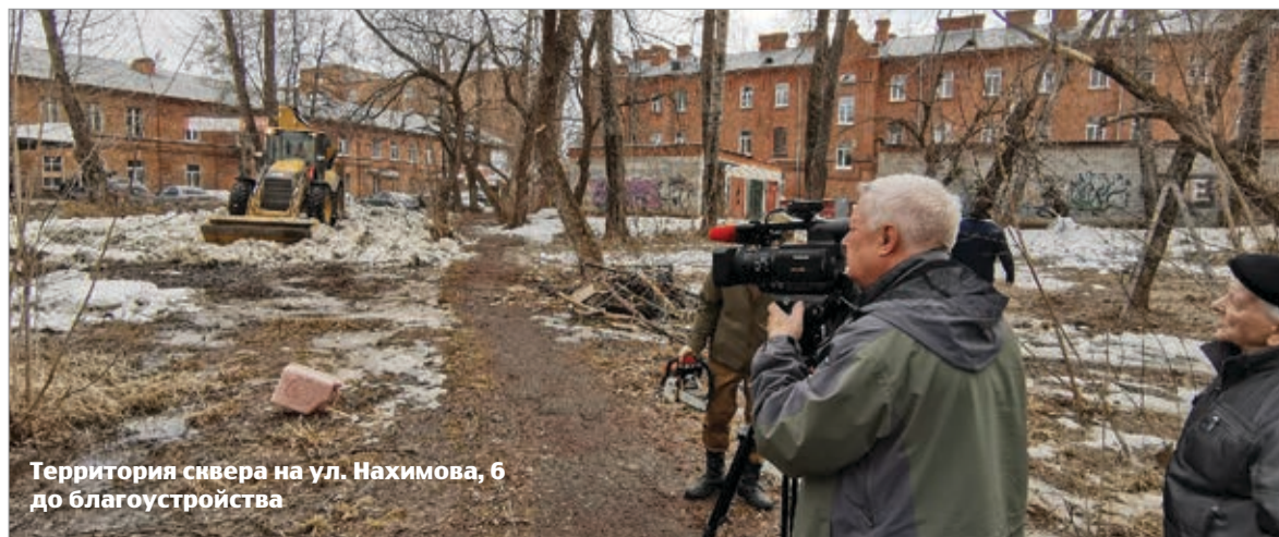
Территория сквера на ул. Нахимова, 6 до благоустройства

Томичи не подвели – сквер победил. В рамках благоустройства здесь запланирована установка садово-парковых диванов, монтаж систем освещения. Существующие деревья и кустарники приведут в пристойный вид – подрежут, при необходимости обновят. Появятся здесь и газон с цветниками, и дорожки с новой тротуарной плиткой. В целом