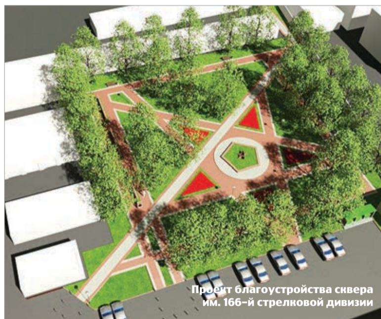
Проект благоустройства сквера им. 166-й стрелковой дивизии