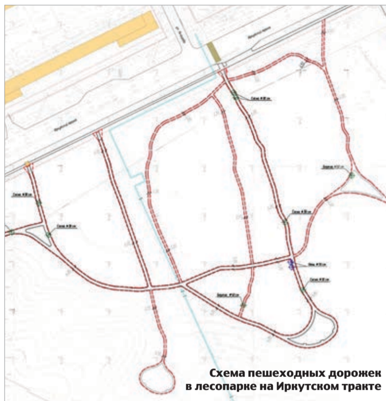
Схема пешеходных дорожек в лесопарке на Иркутском тракте

Кроме того, на выбор горожан будут предложены четыре объекта, из которых большинством голосов будут выбраны два. Это сквер у ЦУМа (ул. Р. Люксембург, 8) или сквер по ул. Трудовой, 15–17; сквер по ул. Железнодорожной (ул. Вокзальная, 43, – ул. Железнодорожная, 60–62) или сад «Белое озеро».