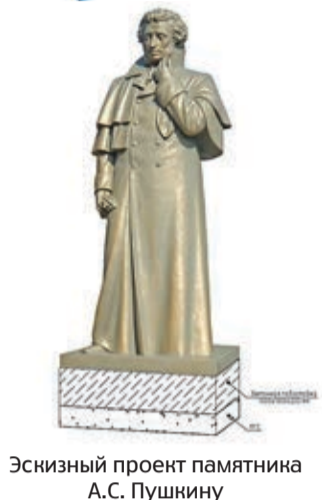
Эскизный проект памятника А.С. Пушкину

В Томске завершен отбор подрядчиков для благоустройства 16 общественных пространств, участвующих в федеральном проекте «Формирование комфортной городской среды» в 2023 году. 15 апреля начнется голосование, в ходе которого томичи смогут выбрать еще 16 территорий, которые будут благоустроены через год.