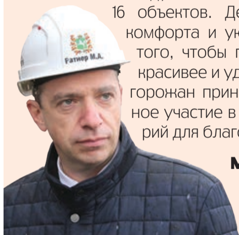
Михаил Ратнер, и.о. мэра Томска

Благодаря участию в федеральном проекте «Формирование комфортной городской среды» Томск за последние годы благоустроил более 70 различных общественных пространств: скверов, парков, детских и спортивных площадок. В 2024 году к ним добавятся еще 16 объектов. Делается это для комфорта и уюта томичей, для того, чтобы город становился красивее и удобнее. Призываю горожан принять самое активное участие в выборе территорий для благоустройства.