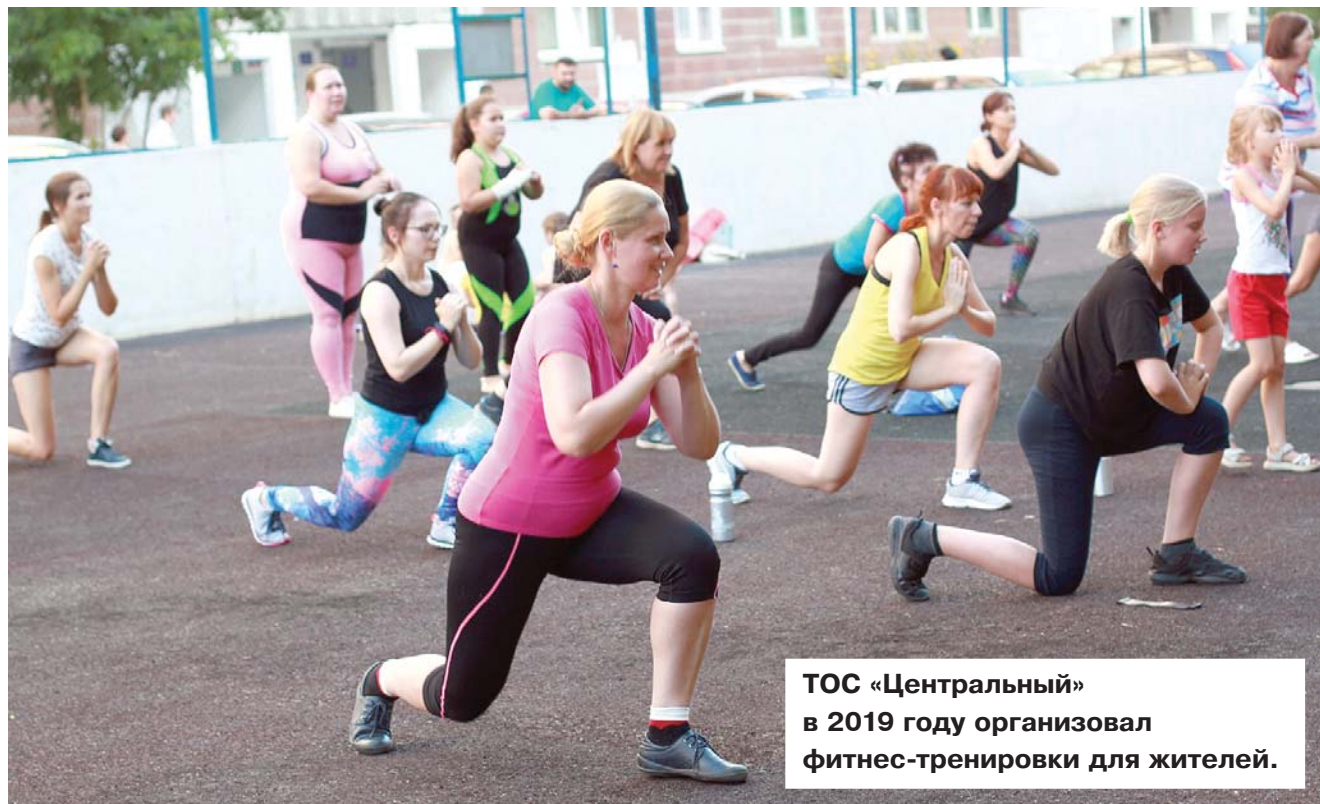
ТОС «Центральный» в 2019 году организовал фитнес-тренировки для жителей.

Далее необходимо направить заявление с приложенным протоколом собрания (конференции) и с иными документами в комиссию по установлению границ территории осуществления территориального общественного самоуправления (управление информационной политики и общественных связей администрации города Томска), которая после принятия положительного решения направляет проект решения в Думу города Томска. После утверждения границ территории Думой Устав ТОСа регистрируют в администрации района, к которому относится данная территория. С этого момента ТОС создан.