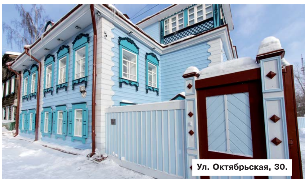
Ул. Октябрьская, 30.