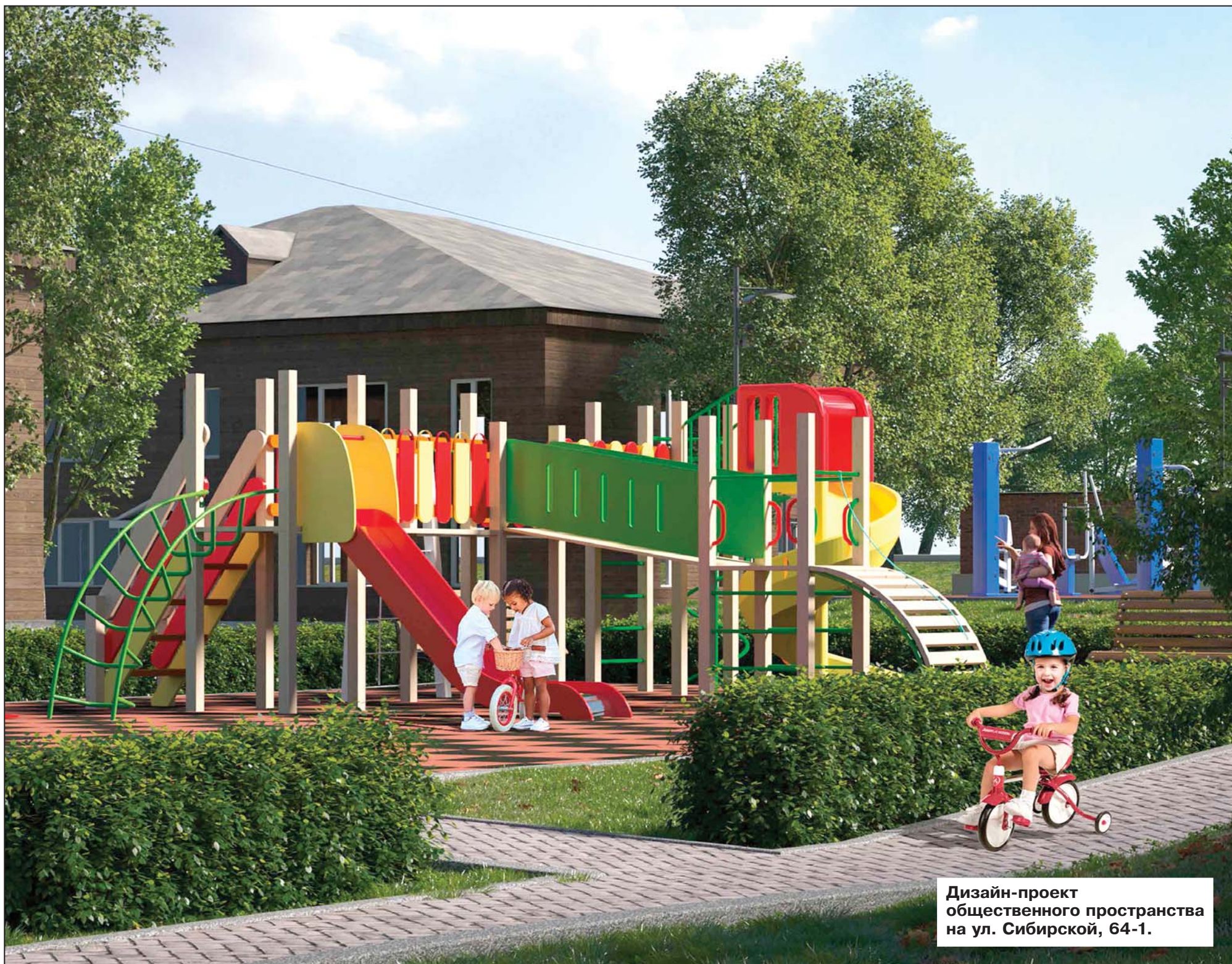
Дизайн-проект общественного пространства на ул. Сибирской, 64-1.