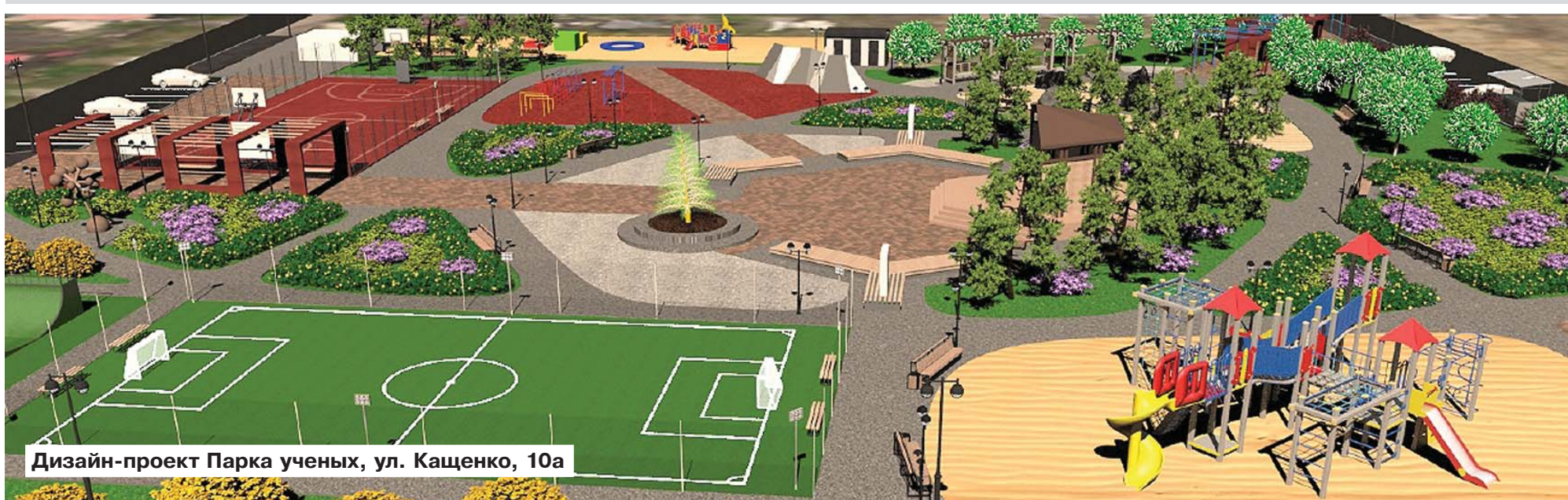
Дизайн-проект Парка ученых, ул. Кащенко, 10а