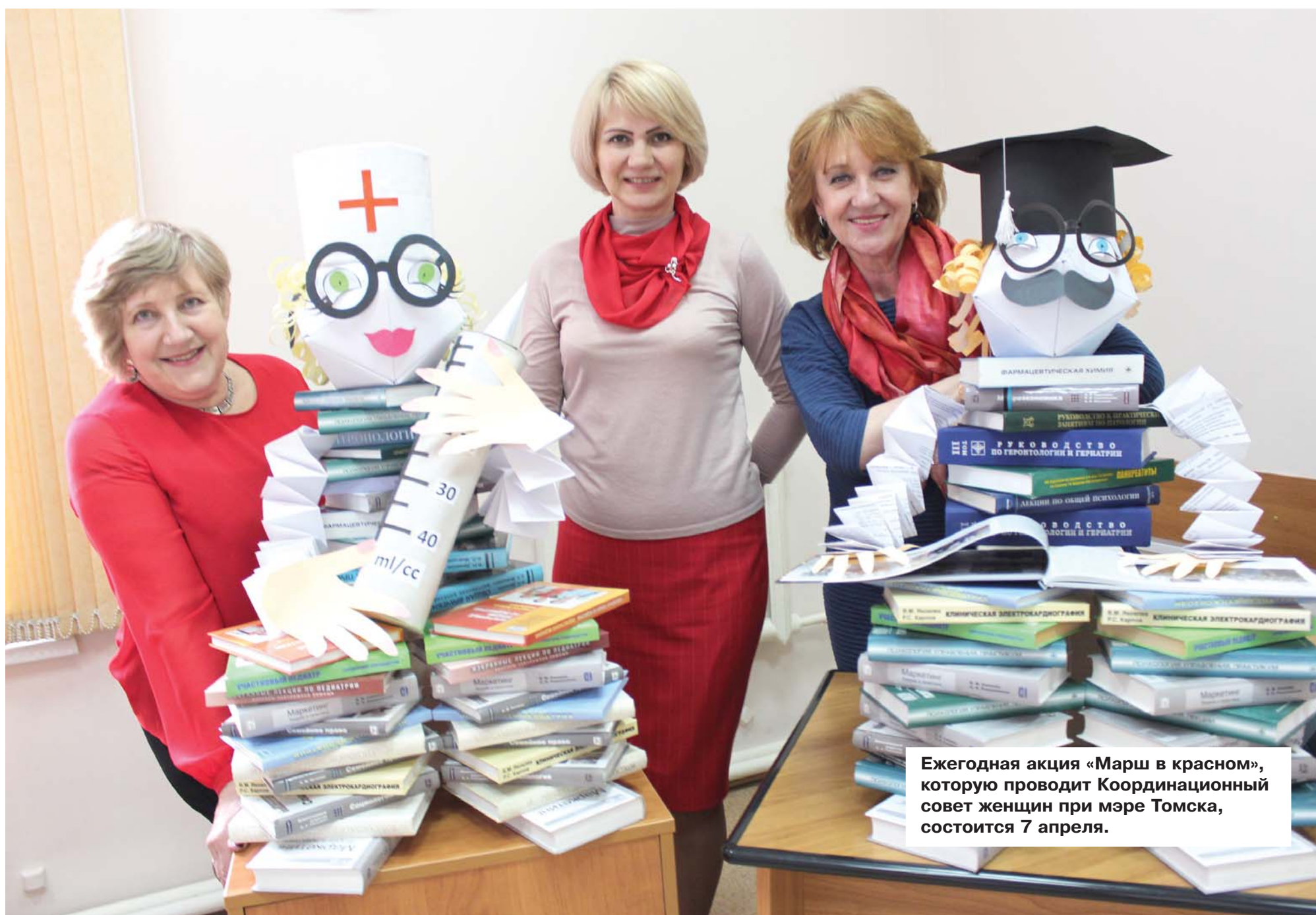
Ежегодная акция «Марш в красном», которую проводит Координационный совет женщин при мэре Томска, состоится 7 апреля.