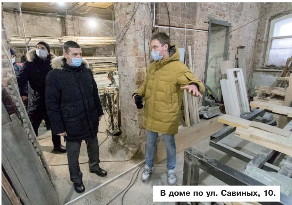
В доме по ул. Савиных, 10.

Сейчас арендную плату в один рубль в муниципальный бюджет вносят арендаторы уже пяти зданий, украшающих улицы