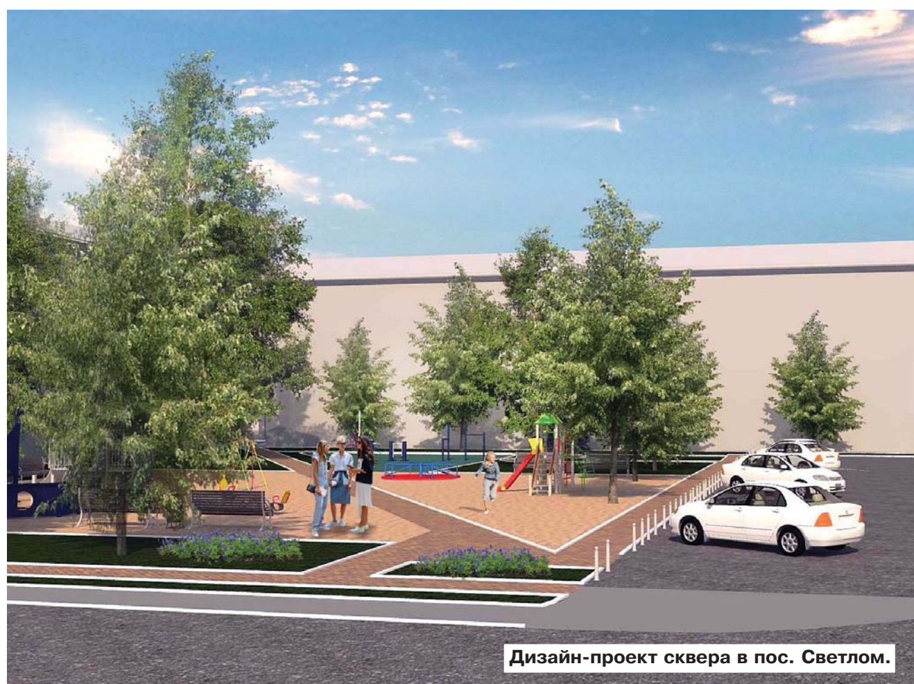
Дизайн-проект сквера в пос. Светлом.