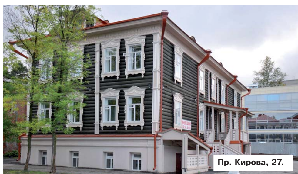
Пр. Кирова, 27.