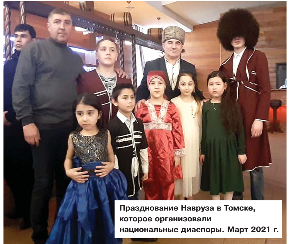
Празднование Навруза в Томске, которое организовали национальные диаспоры. Март 2021 г.