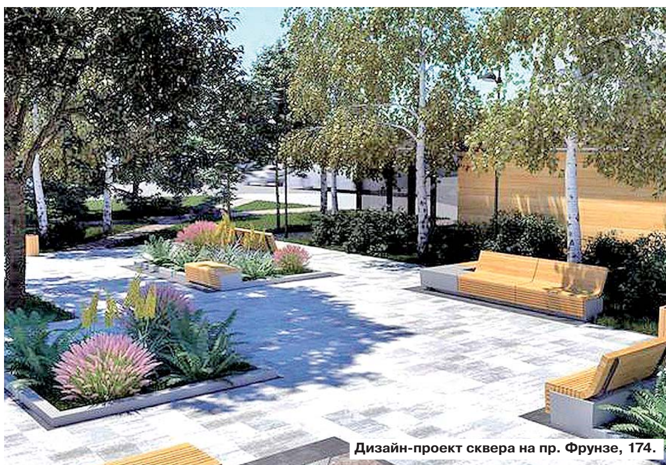
Дизайн-проект сквера на пр. Фрунзе, 174.