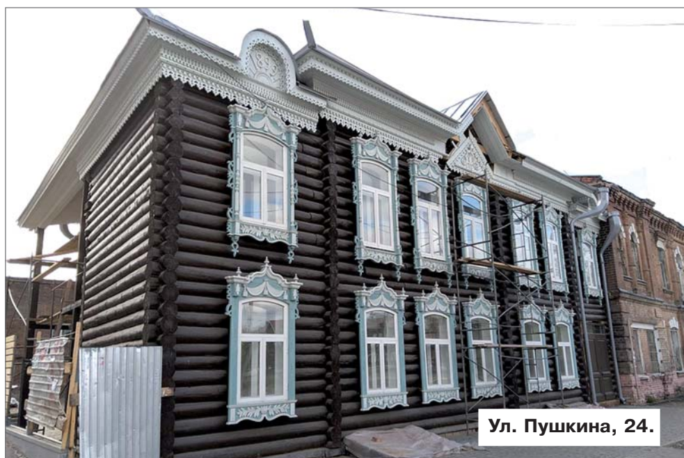
Ул. Пушкина, 24.