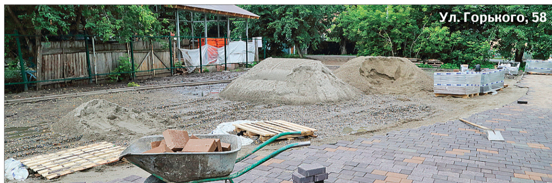
Ул. Горького, 58

Как идет благоустройство общественных пространств Томска