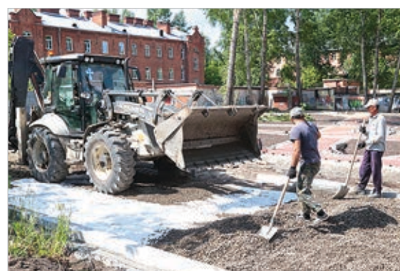
Сквер имени 166-й стрелковой дивизии

учтен опыт прошлого сезона, когда из-за несвоевременной поставки материалов и оборудования сроки благоустройства затянулись. Сейчас мы видим – строители стремятся выполнить работу досрочно, но без ущерба