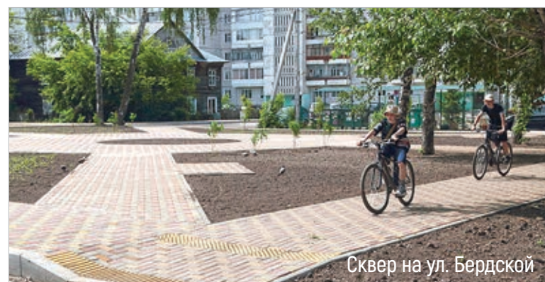
Сквер на ул. Бердской

внутриквартальных проездов, примыкающих к скверу, а также привлечь социальных партнеров к обновлению фасада и ступеней часовни Преображения Господня, расположенной в центральной части сквера.