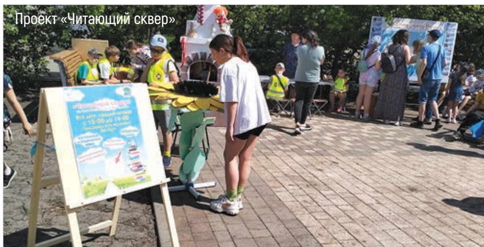
Проект «Читающий сквер»

Конкурсы «Лучший ТОС» и «ТОС – территория комфортного проживания» в самом разгаре