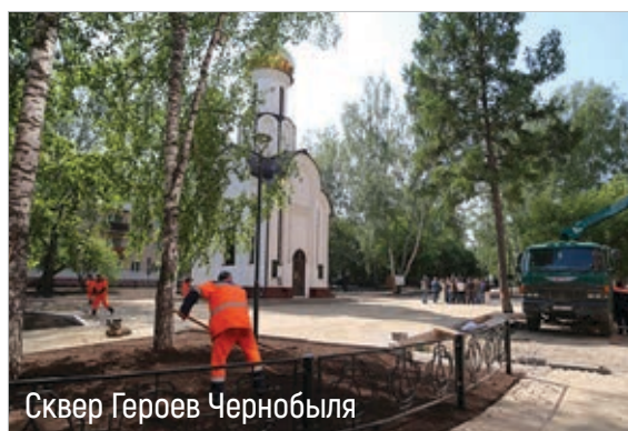
Сквер Героев Чернобыля

Благоустройство – это устройство во благо всем