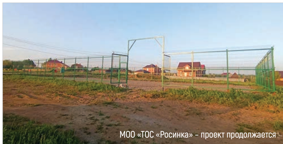
МОО «ТОС «Росинка» – проект продолжается

■ Наталья Екимова