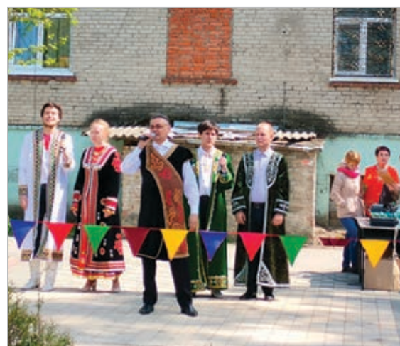
Фотозона «Концертная площадка» в сквере имени В.И. Смирнова