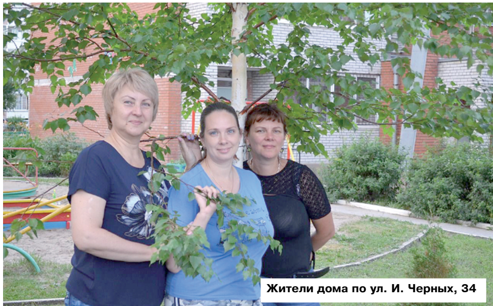
Жители дома по ул. И. Черных, 34

Есть на территории Октябрьского района место, которое по праву можно назвать одной из «жемчужин» района, - это, конечно, двор по адресу: ул. И. Черных, 34. Это место притяжения не только для живущих в доме людей, но и также для жителей всех домов, расположенных рядом.