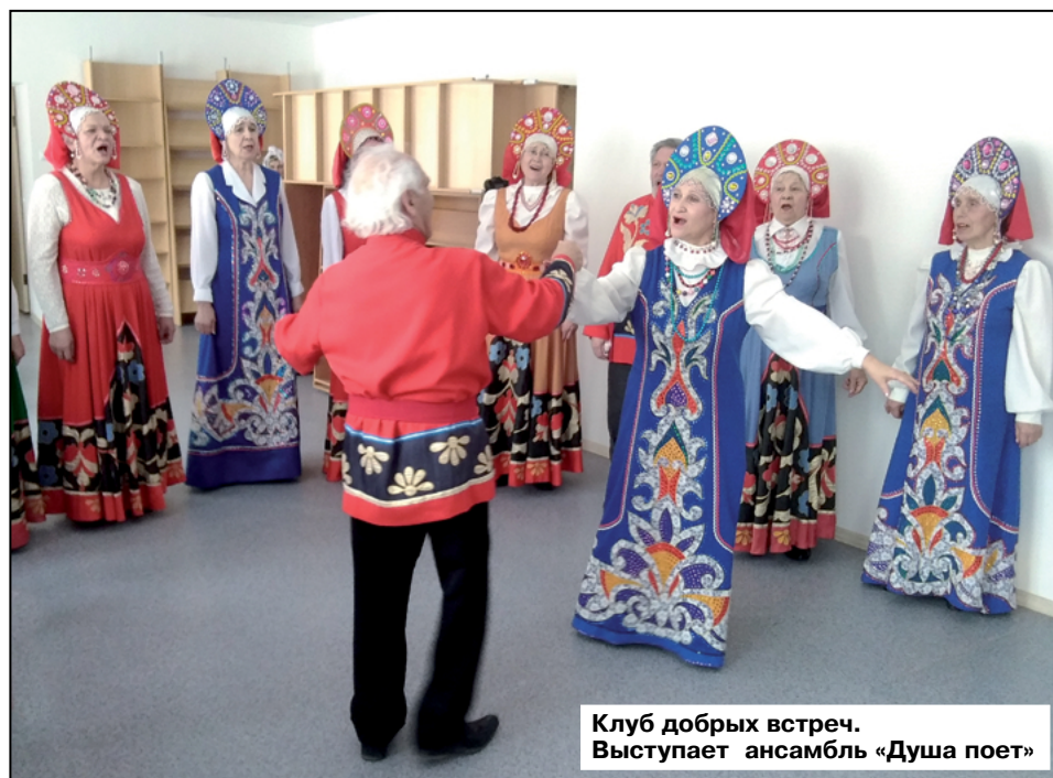
Клуб добрых встреч. Выступает ансамбль «Душа поет»

У нас было все: проектная команда, идея, опыт и курсовая поддержка опытных коллег. Идея проекта пришла к нам, что называется, сама. Мы обратили внимание на то, что когда мы проводим массовые мероприятия, то на них присутствует много пенсионеров, а в отзывах пожилые люди пишут о том, что им не хватает общения, что очень мало форм и возможностей для того, чтобы встречаться. Обратив на это внимание, мы провели небольшое исследование, в ходе которого опросили пенсионеров, нуждаются ли они в формах организации досуга и в каких именно. Так