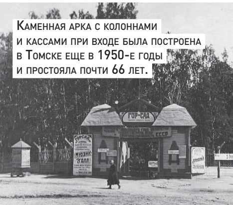
Каменная арка с колоннами и кассами при входе была построена в Томске еще в 1950-е годы и простояла почти 66 лет.

Восстановленная арка в Городском саду стала отдельным пунктом для посещения мэра в рамках его традиционного объезда. Оно и понятно, работа над проектом восстановления несколько затянулась из-за необходимости проведения археологических изысканий и согласования этой работы с Минкультом РФ. Зато теперь здесь есть на что посмотреть! Помещения внутри арки будут оборудованы сенсорным экраном, выставочными стендами, удобной мебелью. На втором этаже откроется туристско-экскурсионный центр, в левой стороне арки – сувенирный магазин и помещение для работы экскурсоводов. Рядом со зданием появится велосипедная парковка на сто мест и пункт проката велосипедов (планируется закупить 30 велосипедов).