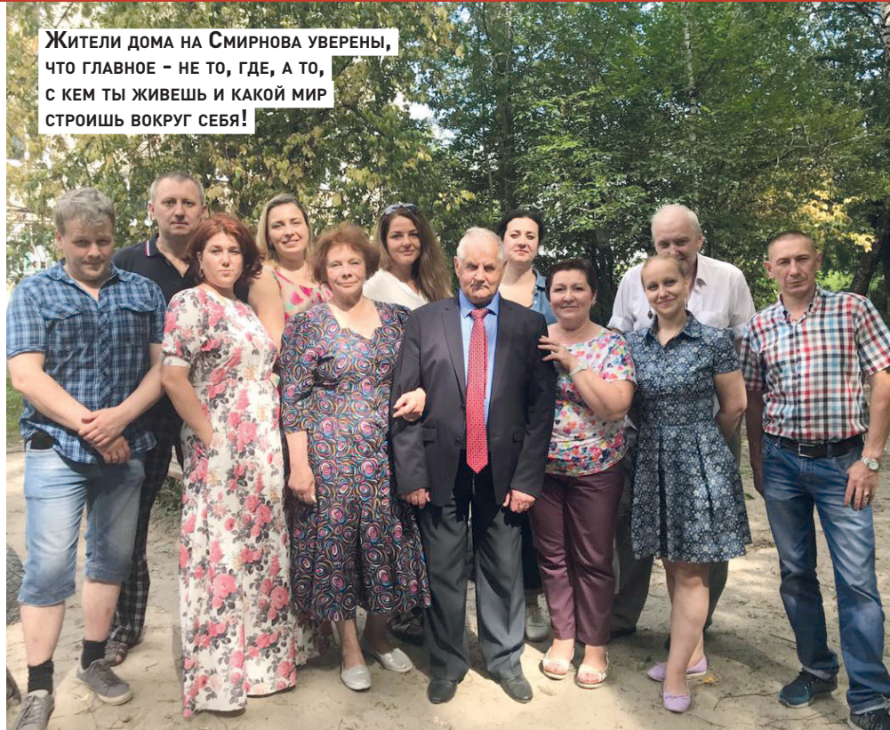
Жители дома на Смирнова уверены, что главное – не то, где, а то, с кем ты живешь и какой мир строишь вокруг себя!

«У нас в уголке сделан стол, установлены скамеечки, здесь мы обычно обедаем или ужинаем. Быва-