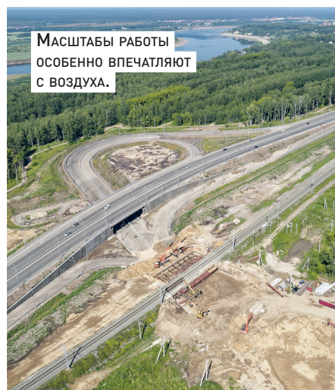
МАСШТАБЫ РАБОТЫ ОСОБЕННО ВПЕЧАТЛЯЮТ С ВОЗДУХА.

ЭТОТ ПРОЕКТ, ИНИЦИИРОВАННЫЙ ГУБЕРНАТОРОМ ОБЛАСТИ СЕРГЕЕМ ЖВачкиным, благодаря которому мы получили масштабное федеральное финансирование, очень значим для города, его транспортной инфраструктуры. С запуском новой развязки мы сможем разгрузить движение от Транспортной площади в сторону Богашевского тракта и ул. Мокрушина, улучшить пропуск транспортных средств в микрорайоны Мокрушинский, Степановский, Южные ворота, поселок Зональный. Томичи смогут быстрее добираться в аэропорт и пригородные поселки. И это существенный шаг вперед в решении транспортных проблем в южной части», – отметил мэр в ходе объезда.