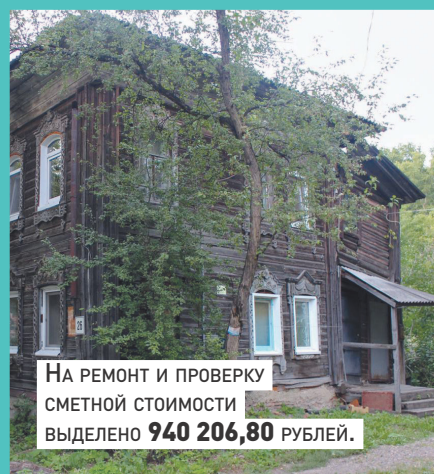
На ремонт и проверку сметной стоимости выделено 940 206,80 рублей.