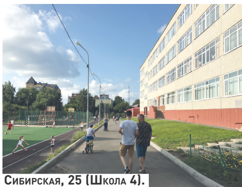
Сибирская, 25 (Школа 4).