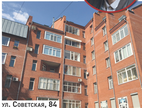
ул. Советская, 84