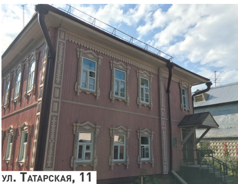
ул. Татарская, 11