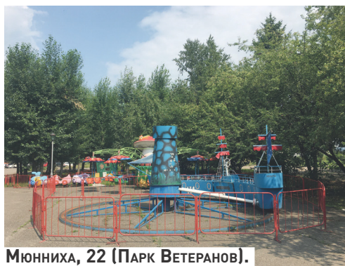
Мюнниха, 22 (Парк Ветеранов).