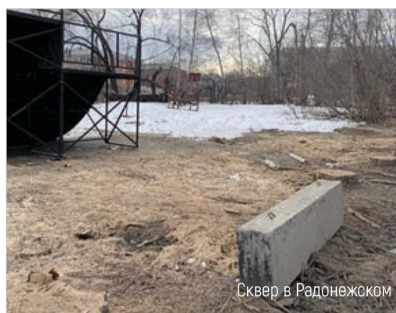
Сквер в Радонежском

В Томске горожане голосуют за варианты дизайн-проектов и территории для благоустройства в 2024 году в рамках федерального проекта «Формирование комфортной городской среды», являющегося частью нацпроекта «Жилье и городская среда». Свой выбор томичи старше 14 лет могут сделать на всероссийской платформе za.gorodsreda.ru или через волонтеров до 31 мая.