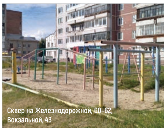
Сквер на Железнодорожной, 60–62, Вокзальной, 43